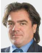
Antoine Hubert AEVIS Holding SA rue Georges-Jordil 4 1700 Fribourg