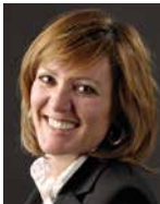
Maude Righi MRI COMMUNICATION Courberaye 34 2012 Avenier