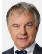
Conrad Engler H+ Die Spitäler der Schweiz, Bern / H+ Les Hôpitaux de Suisse, Berne