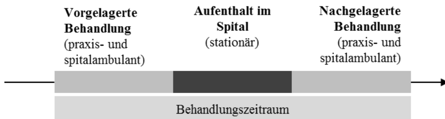
Abbildung 1: Leistungserbringung im vor- und nachgelagerten ambulanten Bereich

Abbildung 1 fasst die Problemstellung grafisch zusammen. Im Zentrum stehen die ambulanten Behandlungen, die in einem gewissen Zeitfenster vor oder nach einem Spitalaufenthalt erfolgen. Das Zeitfenster variiert dabei zwischen 5, 10 und 20 Tagen. Zudem ist eine Differenzierung in spital- und praxisambulante Behandlung möglich.